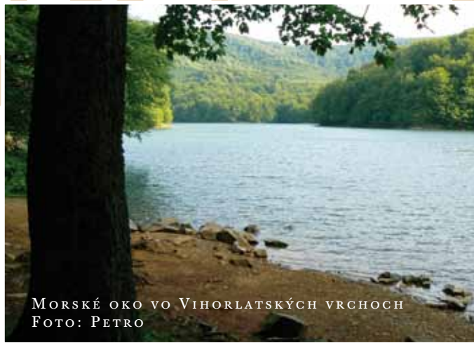
MORSKÉ OKO VO VIHORLATSKÝCH VRCHOCH