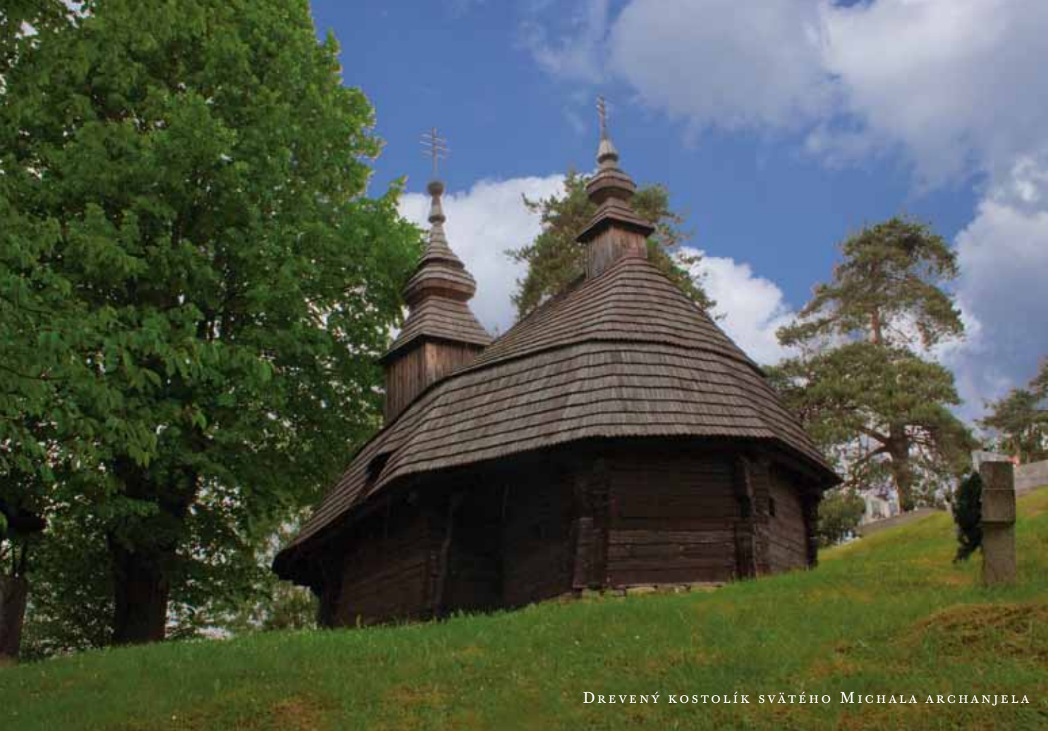
DREVENÝ KOSTOLÍK SVÄTÉHO MICHALA ARCHANJELA