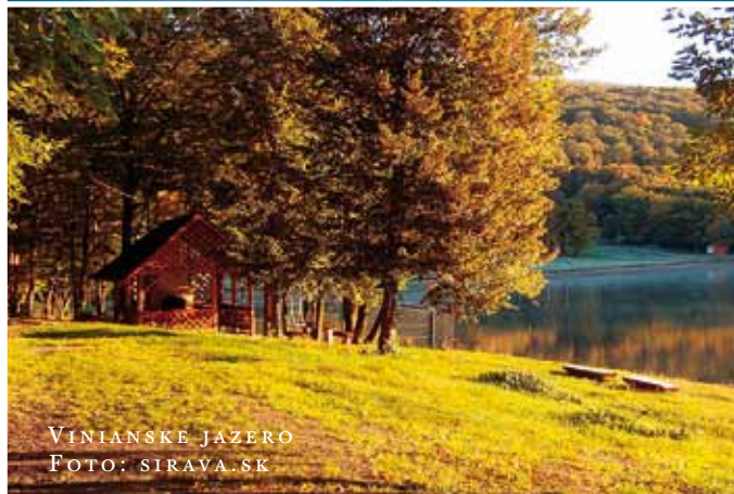
VINIANSKÉ JAZERO