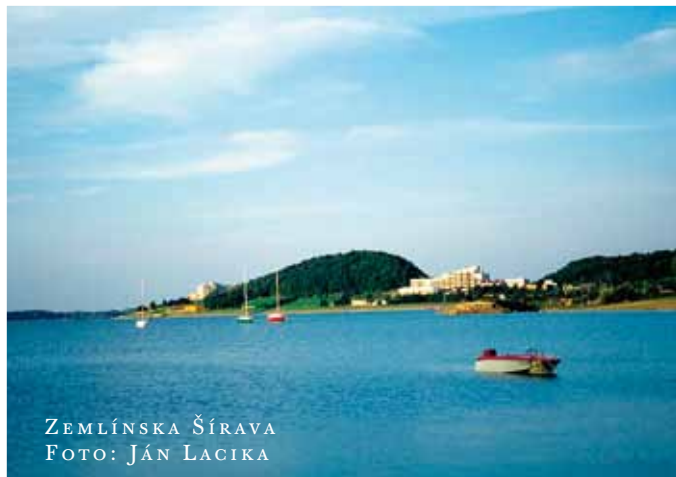
ZEMLÍNSKA ŠÍRAVA